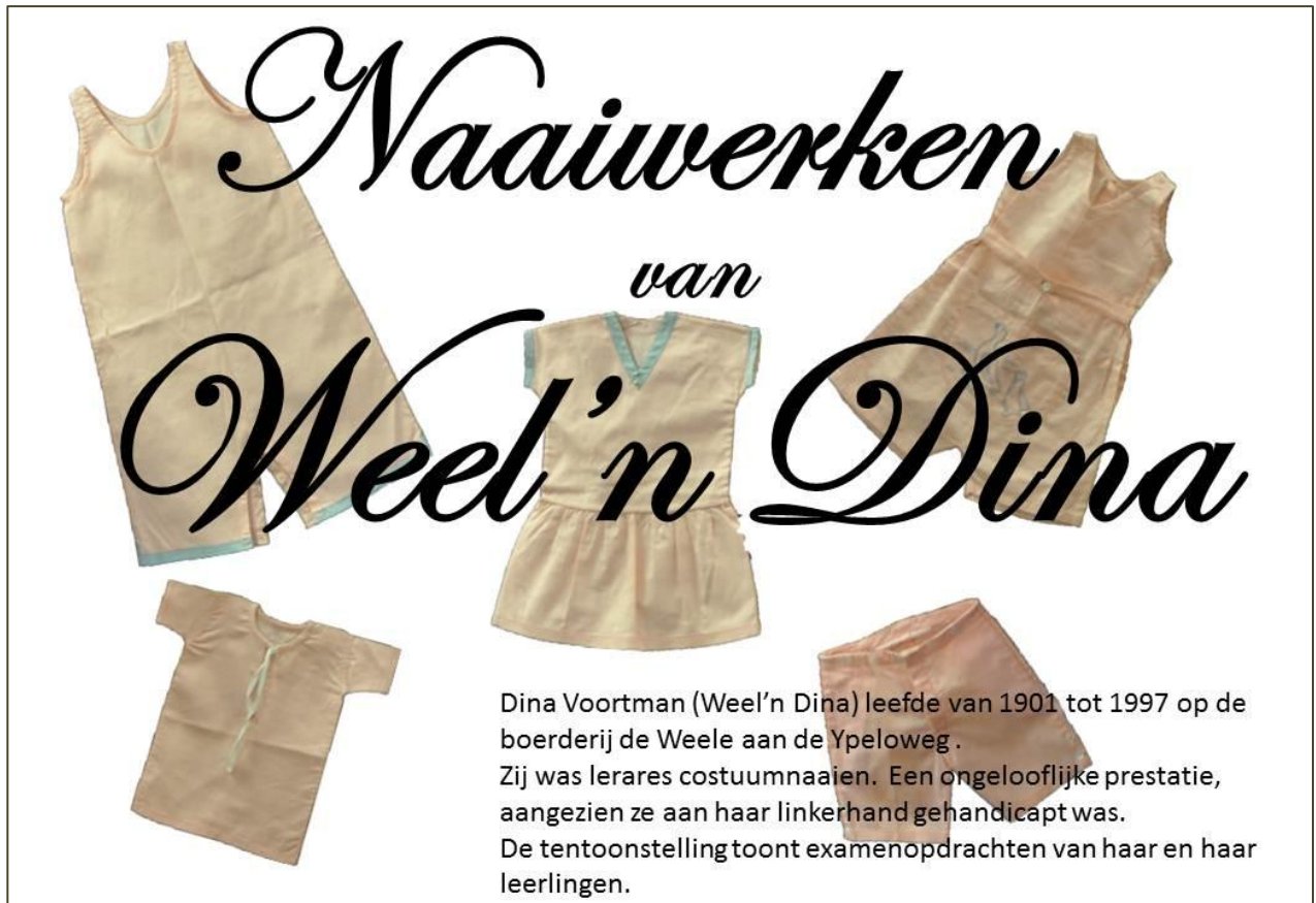
Foto-impresie van de expositie